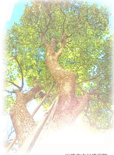
川崎市立川崎病院 シンボルツリー